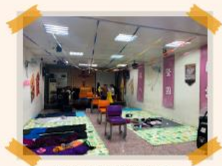
服務據點通鋪教室