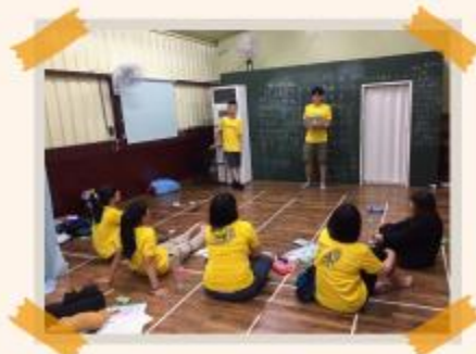
服務據點通鋪教室