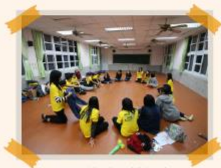
服務據點通鋪教室