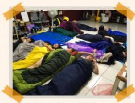
服務據點通鋪教室