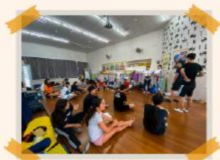
服務據點通鋪教室