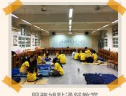
服務據點通鋪教室