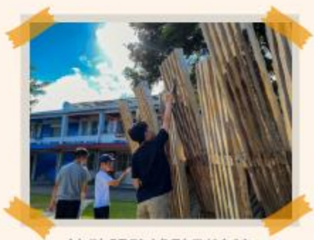
協助服務據點刷油漆