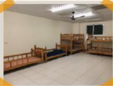
服務據點志工宿舍