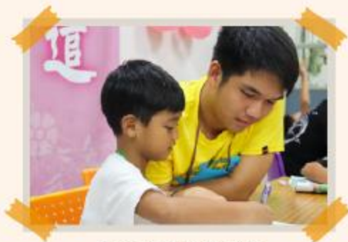
協助孩子課後輔導