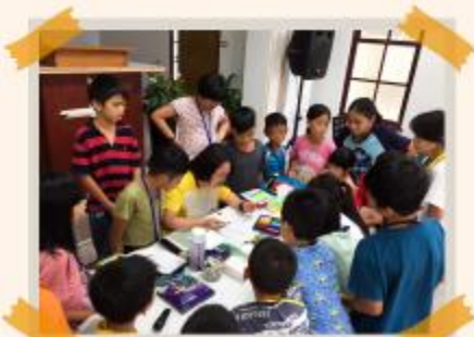
和諧粉彩繪畫課程