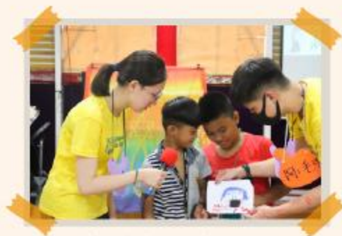
孩子分享自己的手作品