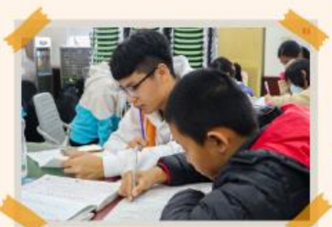
協助孩子課後輔導