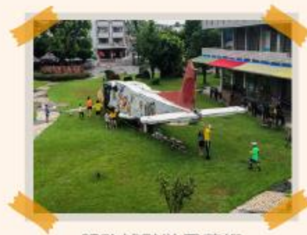
服務據點裝置藝術